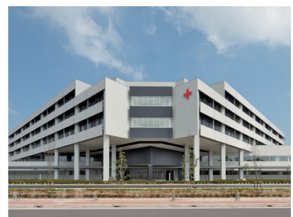
▲代表的なPPP事例、伊勢赤十字病院

プライ（GHS）、医療物流管理システムサービスを提供するエフエスユニマネジメント、医療機器及び医療材料商社の小西医療器、そしてシッヘルスケアアーマシー東日本の4社だ。4社の売上高合計が連結売上高の約75%（2021年3月時点）と全体の約4分の3を占める。