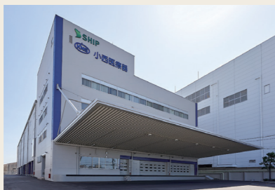
▲大阪ソリューションセンター

膏1枚から計量できる自動梱包機など、様々な業界初のソリューションを取り込んでいる。現在は関西圏を中心に医療施設への運用を徐々に拡大しており、今後はグループ全体での連携も視野に入れている。