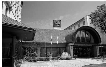
千里阪急ホテル正面外観