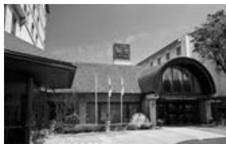
千里阪急ホテル正面外観